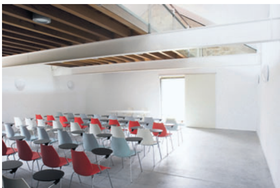
ARROKABE ARQUITECTOS. Escuela náutica en Muros | AMADOR LORENZO