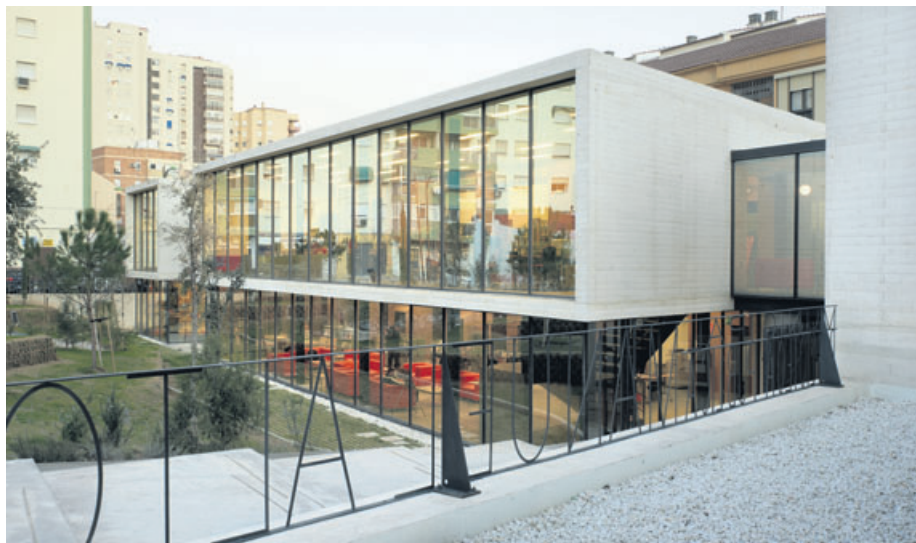
CASTROFERRO ARQUITECTOS. Biblioteca de Manuel Altolaguirre, en Málaga