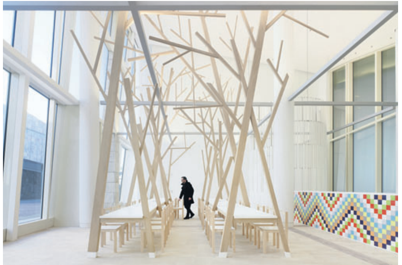
ESTUDIO NÓMADA. Cantina en la Ciudad de la Cultura de Santiago | HÉCTOR SANTOS-DÍEZ