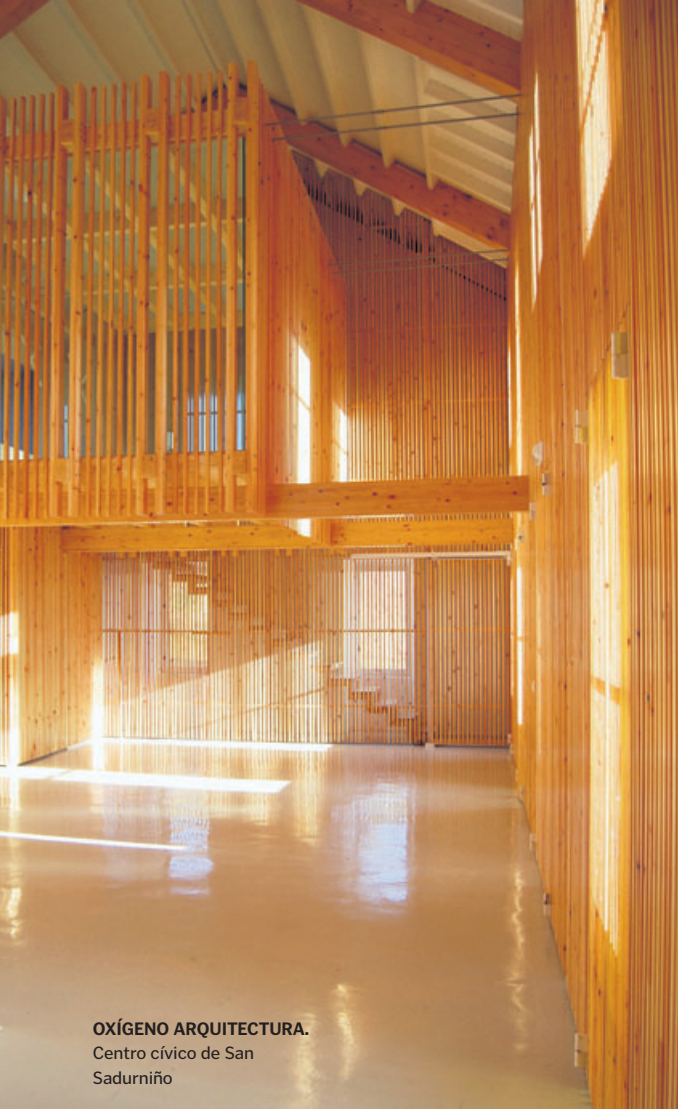
OXÍGENO ARQUITECTURA. Centro cívico de San Sadurniño