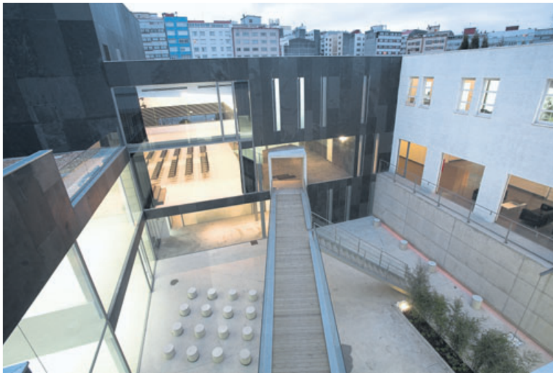
ÓSCAR PEDRÓS. Centro cívico del Castrillón (A Coruña)